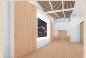
管理棟 玄関ギャラリー