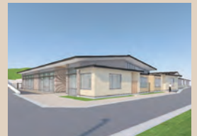
完成予想図(管理棟)