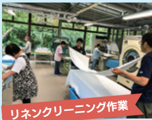
リネンクリーニング作業

主に毎週火・水曜日の午後に、法人内施設の白物リネン及び掛布団類の洗濯作業を実施しています。各利用者の方は、品質と役割を意識しながら、仕上がり枚数の確認を行い、納品を行っています。