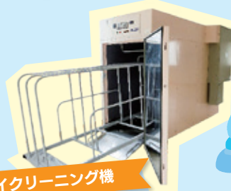
ドライクリーニング機