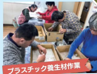
プラスチック養生材作業

2施設(2回/年)官公庁関係依頼の除草作業も3年目を迎え、各利用者は毎回依頼先に信頼を得られるように意欲的に取り組んでいます。作業時には周囲の安全を確保しながら、機械ではできない手作業で、丁寧な除草作業を行っています。