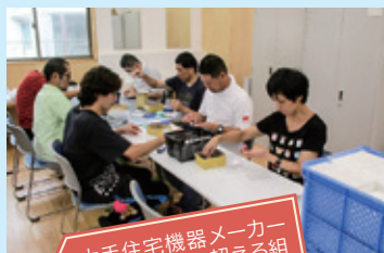
① 大手住宅機器メーカーから10種類を超える組み立て作業を受託

せきれいではチャレンジと体験をスローガンに、利用者と職員が一丸となって様々な社会経験や行事にトライしていきたくと考えています。