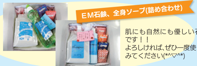
EM石鹸、全身ソープ(詰め合わせ)

一つ一つの部品を組み立てていきます。小さな部品もあり、細かい作業で、丁寧に取り組んでいます。