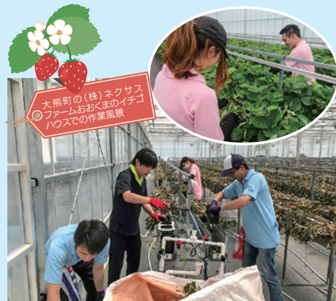
大熊町の(株)ネクサスファームおおくまのイチゴハウスでの作業風景