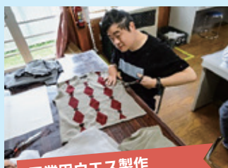
工業用ウエス製作

地域や各施設の皆さんから頂いた古着を同じ大きさに切り、ウエスとして再利用し販売しています。