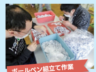
ボールペン組立て作業

自動車ドアのゴムパッキン部分に使用されます。中に入っている針金を抜き取る作業です。