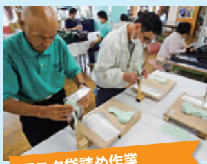
マスク袋詰め作業

また、自主製品としてEM石鹸や全身ソープ、洗濯洗剤や台所洗剤の販売(詰合せも行います。)、EM発酵液や工業用ウエスの製作・販売にも励んでいます。ご注文くださると嬉しいです。