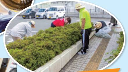
官公庁関係受託除草作業

主に法人内で、日替わり弁当の製造販売を、1日40~50個行っています。日々、衛生的な環境において、体にやさしい食事を考えたメニューで実施しています。