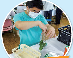
ピーマン袋詰め作業

自動車の電気系統のハーネスとして使用されます。切断機の歯は、とても鋭く、怪我のないよう注意!!です。