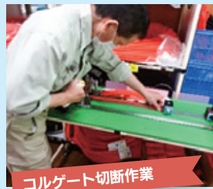
コルゲート切断作業

地域や各施設の皆さんから頂いた古着を同じ大きさに切り、ウエスとして再利用し販売しています。