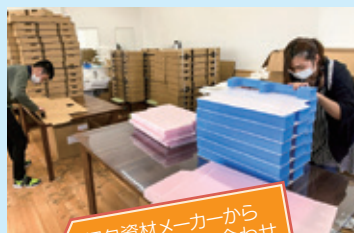
② 梱包資材メーカーから組み立てや張り合わせの作業を受託