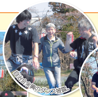
自治会余興のダンス披露。

平成31年度初めての行事として、4月5日に毎年恒例の南相馬市原町区夜ノ森公園にて、桜の花見を行いました。当日は、一気に気温上昇し、23度越えの6月上旬並みになり、汗ばむ日となりました。桜は3分咲きではありましたが、天気が良かったことから、自治会のダンス披露や、コントの出し物と、気温と共にヒートアップして盛り上がりを見せました。花見弁当と柏餅をみんな笑顔で食べ、明るい新年度初めの行事となりました。