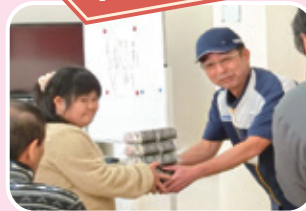
田村市船引町：ミニストップ船引店様 『恵方巻き』寄贈