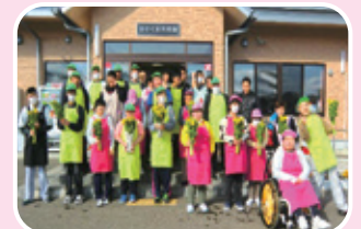
鴨川市：ウミガメ倶楽部様・鴨川義塾様 『菜の花』寄贈