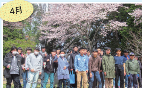
馬陵公園での花見