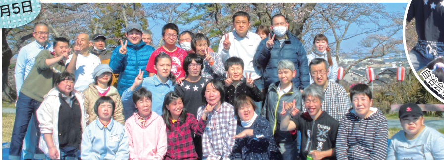
全員集合でバチリ。

平成31年度初めての行事として、4月5日に毎年恒例の南相馬市原町区夜ノ森公園にて、桜の花見を行いました。当日は、一気に気温上昇し、23度越えの6月上旬並みになり、汗ばむ日となりました。桜は3分咲きではありましたが、天気が良かったことから、自治会のダンス披露や、コントの出し物と、気温と共にヒートアップして盛り上がりを見せました。花見弁当と柏餅をみんな笑顔で食べ、明るい新年度初めの行事となりました。